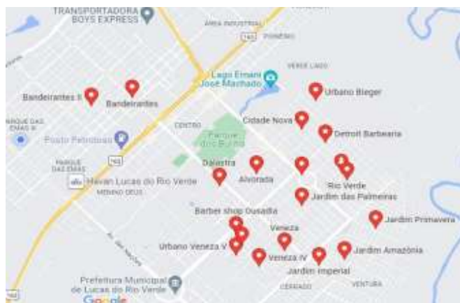
Figura 1. Distribuição dos bairros em Lucas do Rio Verde – MT.