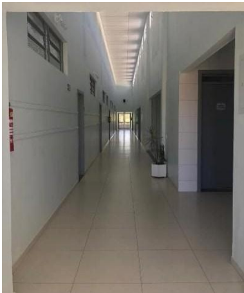
Figura 2 - Corredor Da Instalação

A ideia é que os visitantes transitem por toda a extensão do corredor (Figura 2), andando num sentido apenas ao entrar por uma das portas e sair pela porta paralelamente oposta ao final do corredor, passando e interagindo por sete estações temáticas que comuniquem a identidade do educandário ao longo de sua história e através das memórias pesquisadas, de forma que o espectador seja absorvido pelo espaço visual ali composto (figuras 3 e 4).