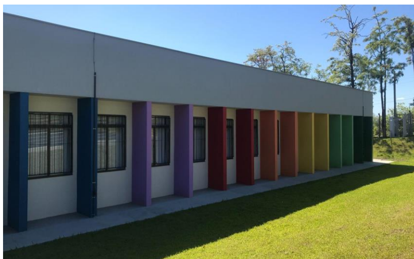
Figura 1 - Edificação da EMEF Professor Guilherme Sommer, em cujo interior localiza-se o corredor que será o ambiente da instalação

O corredor, cujas dimensões são, aproximadamente, 3m x 50m, atravessa o prédio de um lado ao outro, sendo o caminho diário de acesso a maior parte das salas de aula do educandário. As paredes são brancas, não havendo, por enquanto, murais ou ripas para fixação de cartazes em suas paredes. A iluminação natural é excelente pois conta com janelas amplas, próximas ao teto, garantindo a entrada da claridade suficiente sem a necessidade de energia elétrica em dias de céu claro. A instalação artística estará organizada em sete estações temáticas, com objetos variados, a serem especificadas mais adiante.