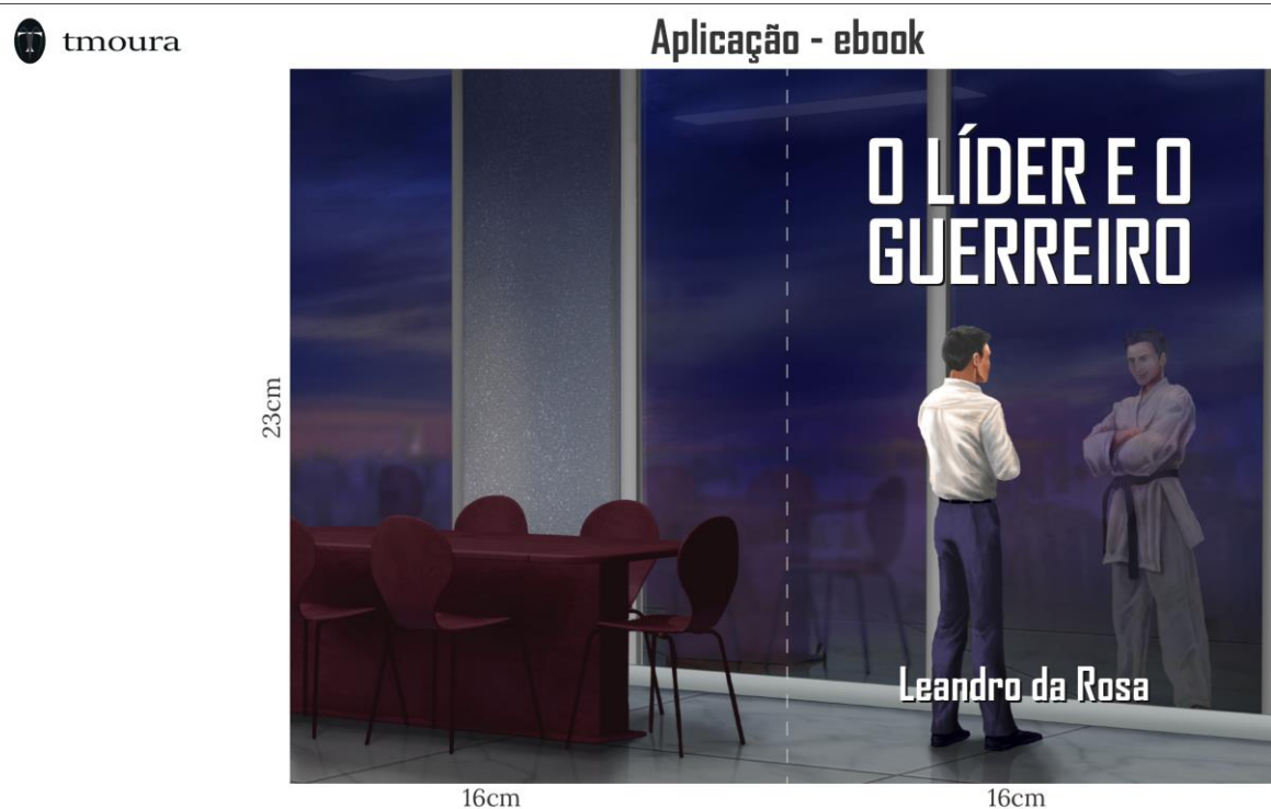
Figura 1 Capa do livro ebook (futuro produto técnico)

O Intenção principal deste projeto é o de socializar um entendimento significativo das práticas adquiridas durante mais de 30 anos por meio das artes marciais japonesas e da gestão de projetos de maneira a aprimorar as competências de líderes, a partir do embasamento da memória social, por meio de um livro.