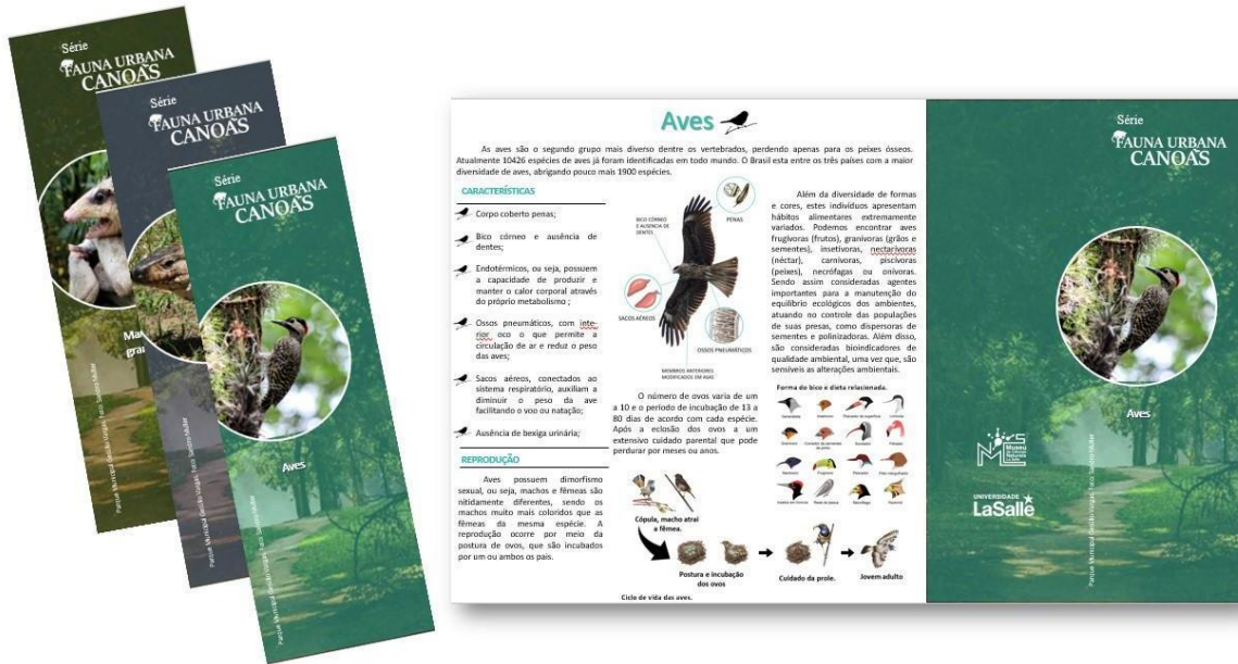
Figura 1 – Protótipo da série de folders “Fauna Urbana de Canoas”, apresentando o design inicial proposto pela autora. Em destaque, a face frontal interna do folder AVES.