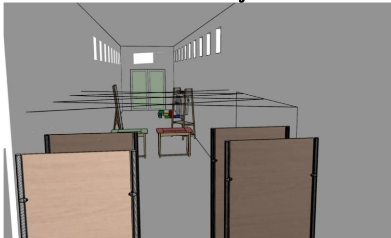
Figura 3 – Primeira Versão Do Projeto Gráfico Da Instalação