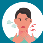
Dificuldade respiratória aguda

Algumas pessoas que estão infectadas podem não apresentar sintomas, mas transmitem o vírus.