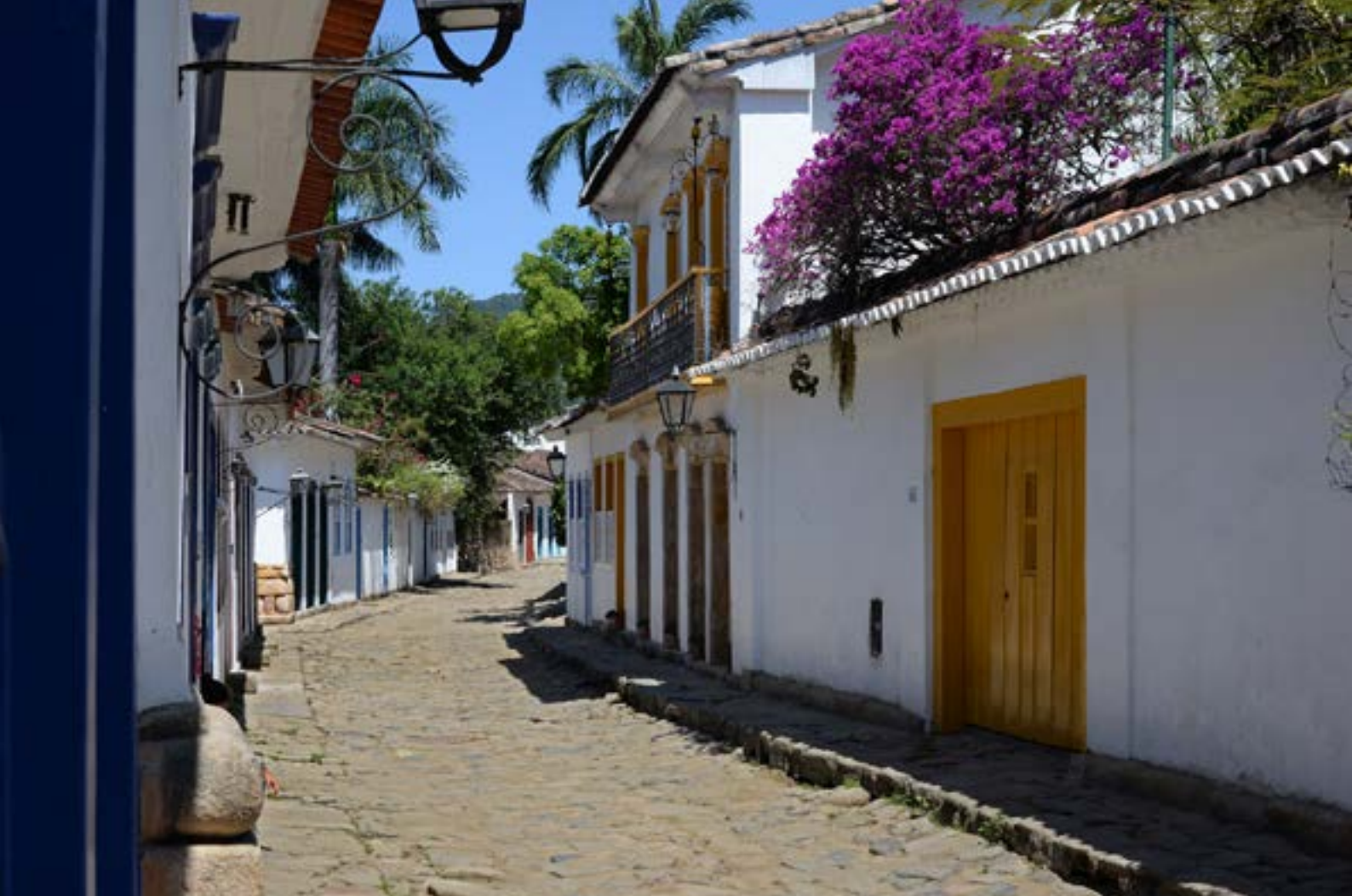
Paraty – Centro Histórico.