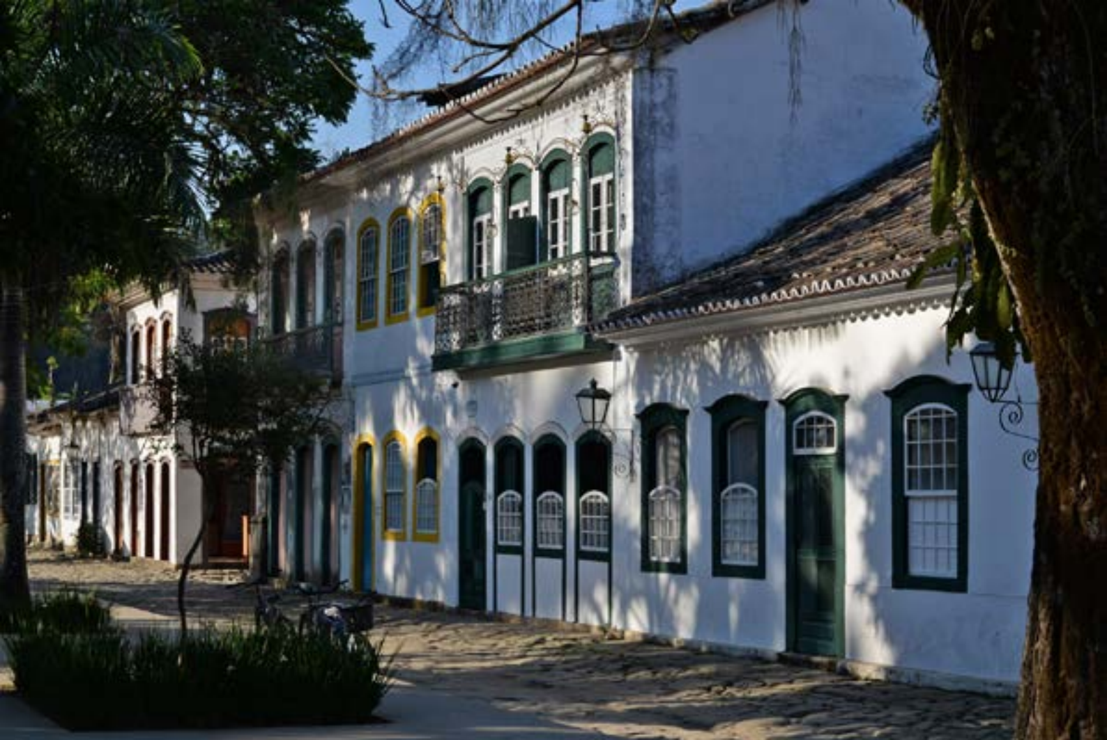
Paraty – Centro Histórico.

sencialmente ao turismo, segundo as redes sociais e mídias locais, já começa a ser afetado por comerciantes abandonando os seus negócios, falências e demissões. Em meio a isso tudo, embora seja uma parcela mínima, é surreal a negação da ciência e o descaso com a possibilidade de uma progressão epidemiológica de um vírus que pode vir a ser fatal. A opção em manter o isolamento pode estar relacionada com a desconfiança na eficácia da proposta de uma reabertura progressiva do comércio, mesmo iniciando com sistema de rodízio, como forma de reduzir a circulação e concentração de pessoas nas ruas ou exclusivamente com sistemas como drive-thru e/ou delivery, e depois evoluindo para o atendimento em lojas com uso de toda proteção necessária. Pois, uma vez que Paraty, assim como tantas outras cidades brasileiras, não possui testes para dar conta de um acompanhamento dos indicadores da doença, entre número de casos sus-